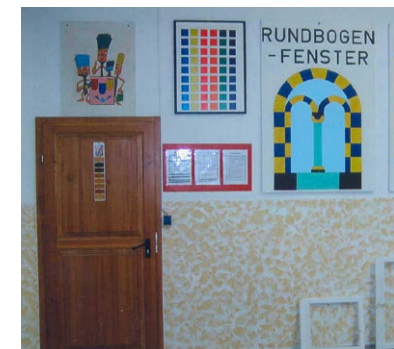
Farb-, Holz- und Sanitärtechnik